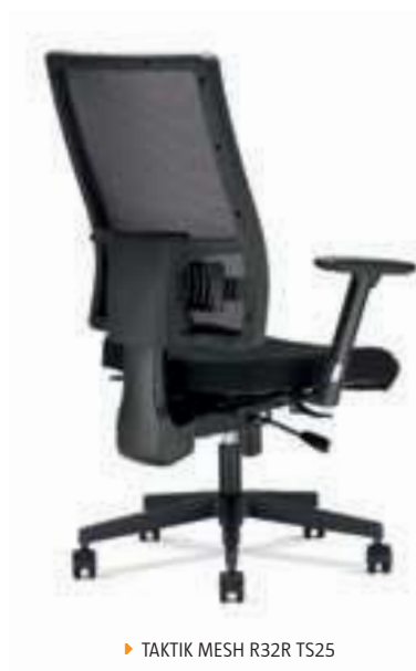
▶ TAKTIK MESH R32R TS25 + ACTIVE 1-TR