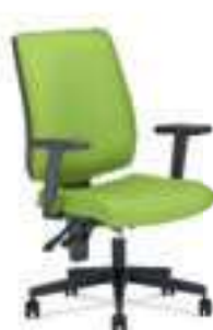
▶ TAKTIK R19T + ERGON 2L