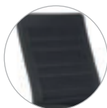
Oparcie zgrzewane ultradźwiękowo