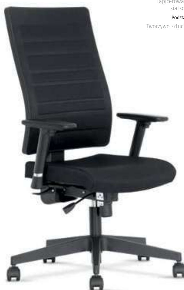
▶ TAKTIK MESH PLUS R32R TS25 + FS