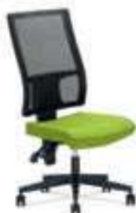
▶ TAKTIK MESH RTS TS25 + ERGON 2L